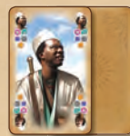
1 Jokerkarte und 1 Reisekarte

Unterhalb der Afrikakarte werden die Expeditionskarten wie folgt platziert: